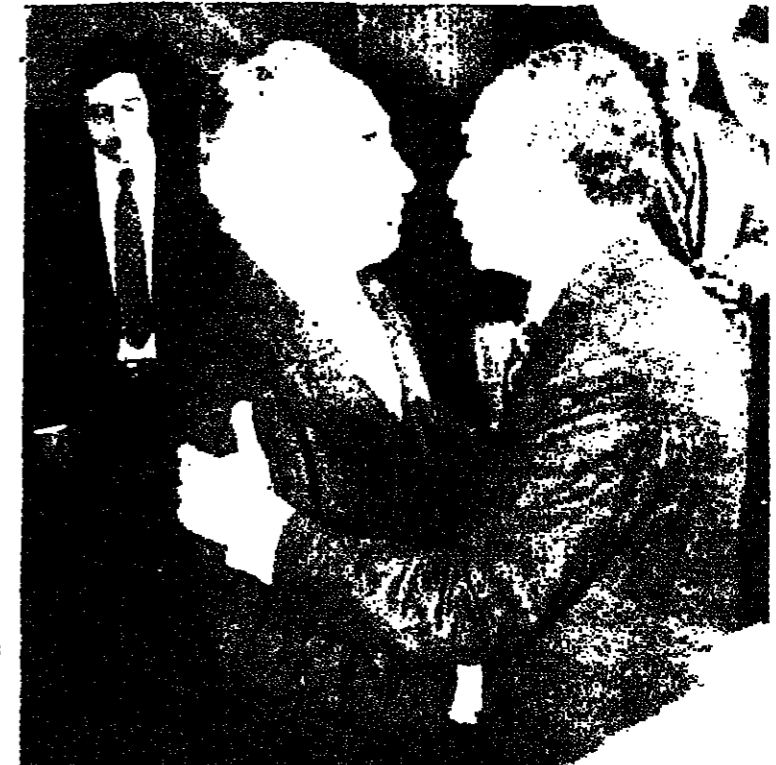
الرئيس السادات لدى لقائه مع شمعون بيرس

ومن ناحية اخرى صرح الدكتور بطرس غالي لراسل صوت اسرائيل باللغة العربية في القاهرة امس انه لا توجد خلافات جوهرية بين موقف مصر وموقف حزب العمل الإسرائيلي من ضم الفلسطينيين والاردن الى مفاوضات الحكم الذاتي الذاتي والاعتراف القلبي هي تاتوية وان الهدف هو هدف مشترك وهو العمل على اجل استجاب السلام في المنطقة والتدريج من التفاوض والاتصالات الدبلوماسية حتى يمكن التغلب على جميع العقبات .